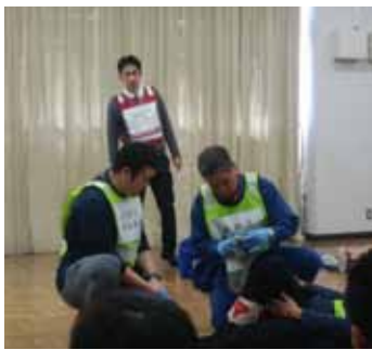
消防団安全教育訓練セーフティファーストエイド研修。地域防災の担い手として、日々鍛錬しています

際、重視したのは「担い手を疲弊させないこと」。有志の無償労働に頼らない運営にチャレンジしました。2点目「地域防災」では、消防団員として、台風19号への対応、塞ノ神・若葉台夏祭り花火への協力などに参加。更に地域の自主防災組織等が連携し、合同避難所設営訓練を行うことで