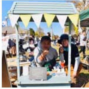
昨年秋には若葉台初のマルシェ。主催者が疲弊せずに、地域で稼げることができる環境整備が必要だと考えています

「一点目」「地域活性化」では、若葉台初の本格的マルシェに関わり、駅前広場を活用した「人の集う場づくり」を目指しました。その