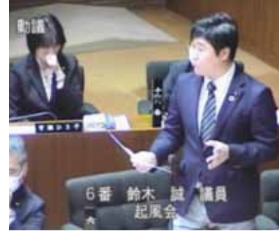
予算組み替え動議提出→使用料手数料に関する関連陳情2件に賛成→本予算に反対した日本共産党は首尾一貫しており、理解できましたが...

財政調整基金(いわゆる市の貯金)から約九千万円(基金の約10分の1)を取り崩して埋めるという内容でした。 鈴木 .. 動議を提出された7名に質疑したところ「使用