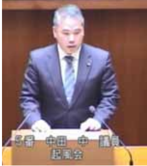
利害関係も良くわかりますが、市税の公平性から、ある程度の受益者負担は致し方ないと考えます

中田 .. 私たちが取り組んでいる地域活動、ICTや防災などの知見を活かし、事業の妥当性・有効性をチェック。直接利害者の視点のみならず稲城市を見渡し、行