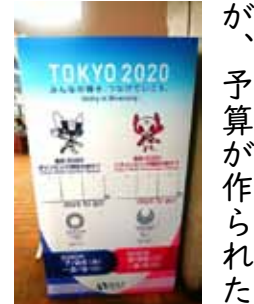
3/24の五輪延期速報を受け、市役所入口のオリパラカウントダウンも、いったん白紙に

「東京五輪2020について一年延期となったわけだが」 鈴木 .. 今予算では、自転車ロードレースに向けた準備や、オリパラのレガシーとなる稲城中央公園サイクルカフェ設置が上程されましたが、予算が作られた時点から感染症拡大により社会状況は激変。前述の通り、今後の補正予算等を含め、どのように対応していくべきか、行政だけでなく議会の側からも知恵を出し合って、復興と併せて良い方向に進んでいけるよう努めます。