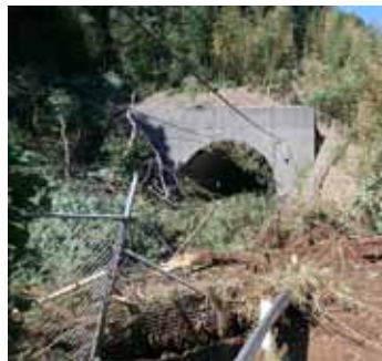
令和元年台風19号翌日、市内巡視。百村の武蔵野南線では土砂崩れも発生、市協力企業により迅速に復旧

今後、矢野口駅周辺土地区画整理事業地区・北東部に公園機能を兼ねた水防拠点を、国土交通省中心に整備されていく予定です。