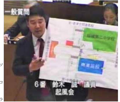
商業施設、稲城第二中学校、上平尾トンネル、学園通りと坂浜平尾線の特製パネルを自作し、詳細に質疑

3月6日、「SOCOLA若葉台」が開業しました。多3・4・17号坂浜平尾線開通直前の11月18日に現地交差点信号機が片側のみと確認。新道開通後、12月5日早朝の中学生登校時間帯