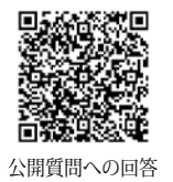
公開質問への回答

「値上げ問題を考える市民の会」様からの公開質問状には、以下に起風会として回答しております。